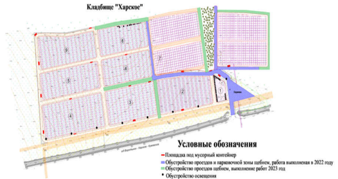
Схема благоустройства территории (проездов и парковки)

Уважаемые жители поселения, наша гражданская активность – залог процветания нашего любимого поселка!